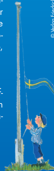
© Verlag Friedrich Oetinger, Illustrationen von Kaitrin Engelking

WORLD CHILDHOOD FOUNDATION FOUNDED BY H.M. QUEEN SILVIA OF SWEDEN